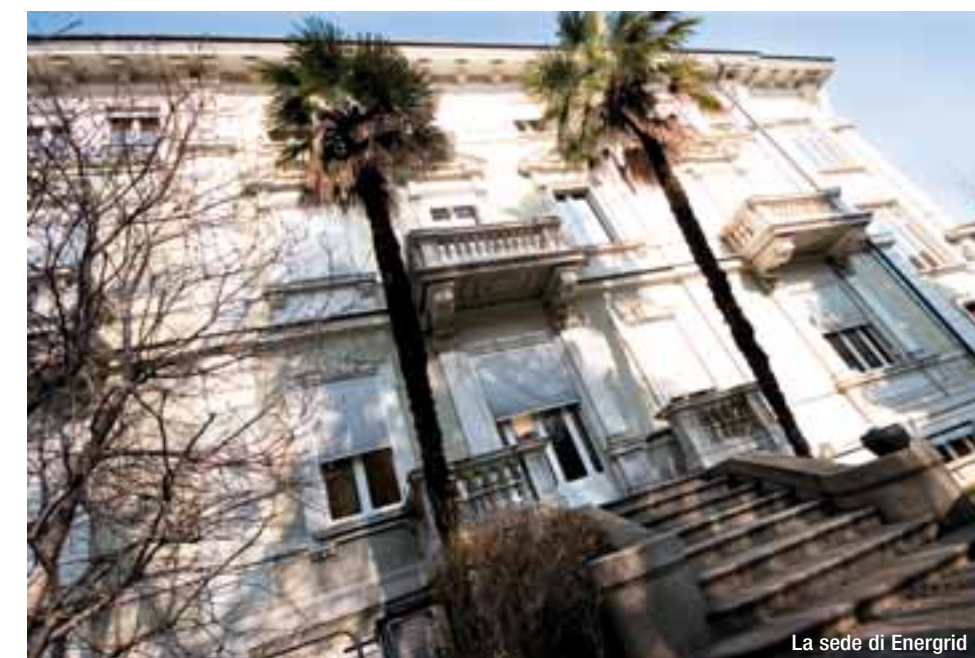
La sede di Energrid